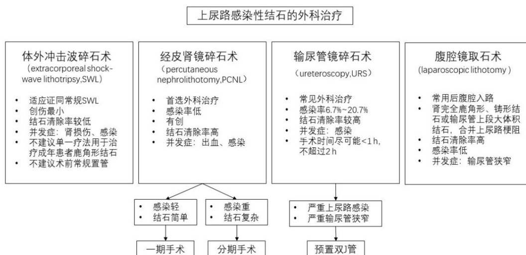
图 2 上尿路感染性结石常用外科治疗方法

6.2.3 脲酶抑制剂治疗 脲酶在感染性结石形成过程中起关键作用,脲酶抑制剂能够抑制尿素水解,降低尿液 pH 值和氨的水平,在减少结石形成的同时也能增强抗菌药物疗效 [20] 。对产脲酶病原微生物导致的感染性结石患者,应在感染严重时联合使用脲酶抑制剂 [19] 。醋羟胺酸是一种